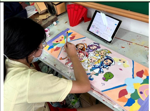
112/5/16 學生堵頭彩繪接近完成