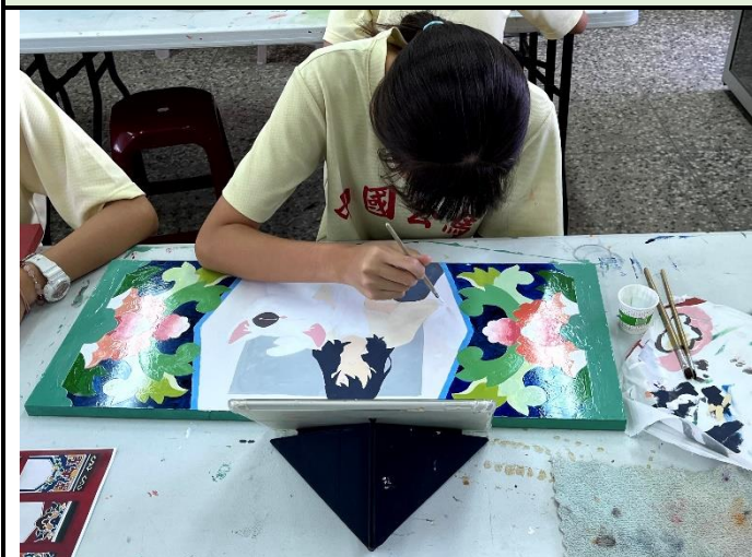
112/5/23 學生堵頭彩繪接近完成