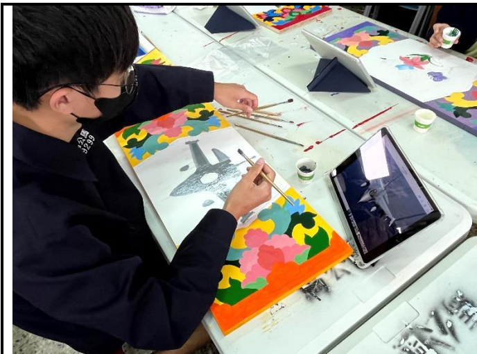
112/5/16 學生堵頭彩繪接近完成