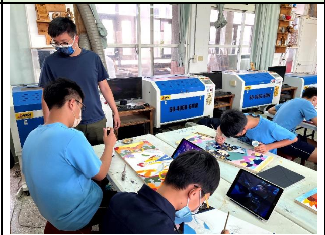
112/5/9 學生繼續進行堵頭彩繪