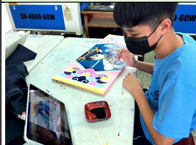
112/5/16 學生堵頭彩繪接近完成