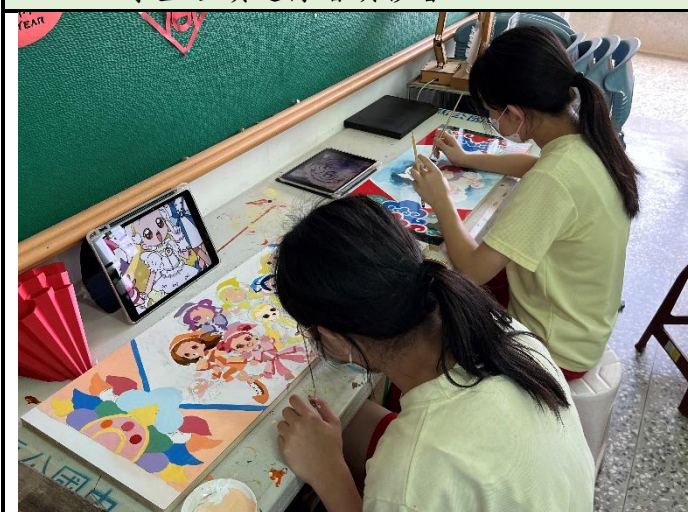
112/5/2 學生繼續進行堵頭彩繪