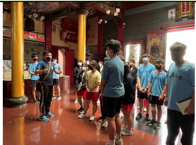
112/5/30 學生進行廟宇踏察並記錄