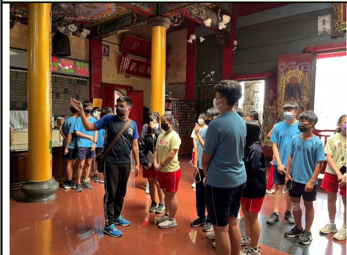
112/5/30 學生進行廟宇踏察並記錄