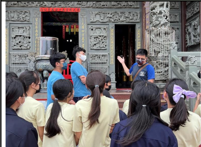
112/5/30 學生進行廟宇踏察並記錄