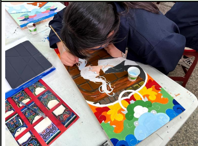
112/5/9 學生繼續進行堵頭彩繪