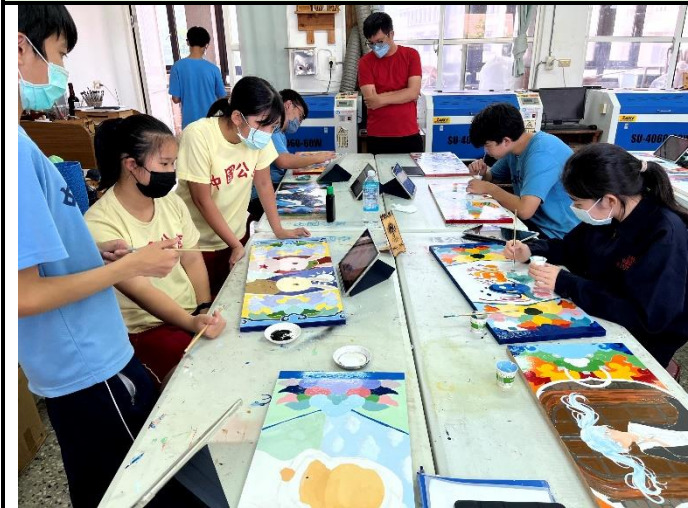
112/5/23 學生堵頭彩繪接近完成