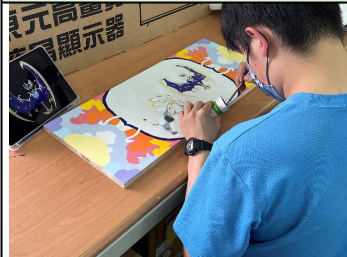
112/5/2 學生繼續進行堵頭彩繪