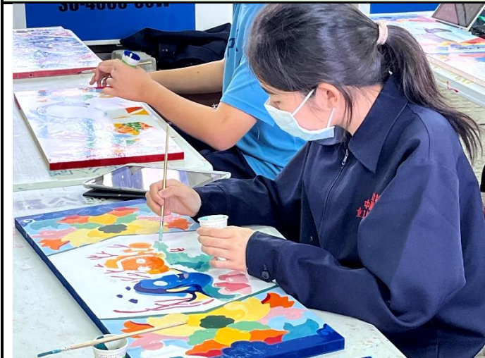
112/5/23 學生堵頭彩繪接近完成