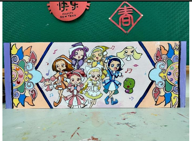
112/5/23 學生堵頭彩繪接近完成