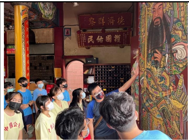
112/5/30 學生進行廟宇踏察並記錄