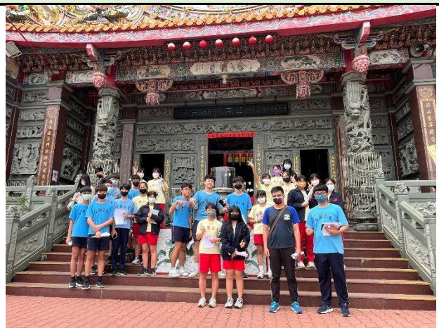
112/5/30 學生進行廟宇踏察並記錄