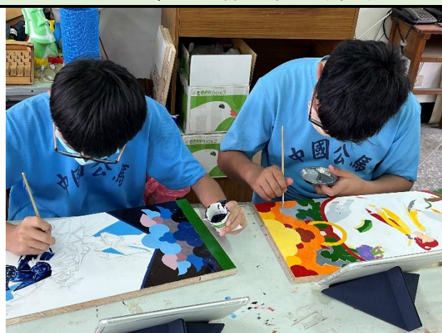
112/5/2 學生繼續進行堵頭彩繪