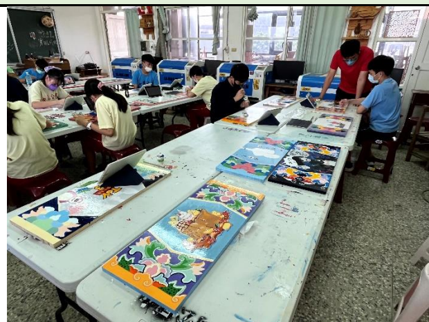
112/5/23 學生堵頭彩繪接近完成