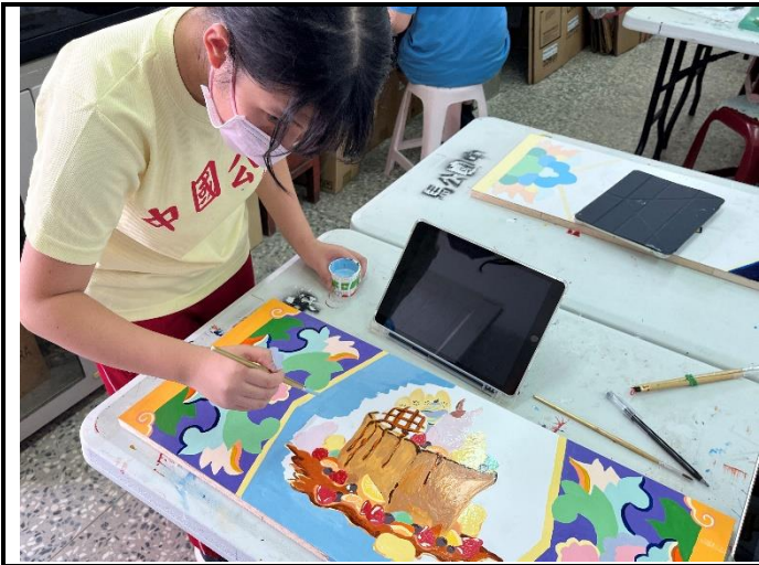
112/5/2 學生繼續進行堵頭彩繪