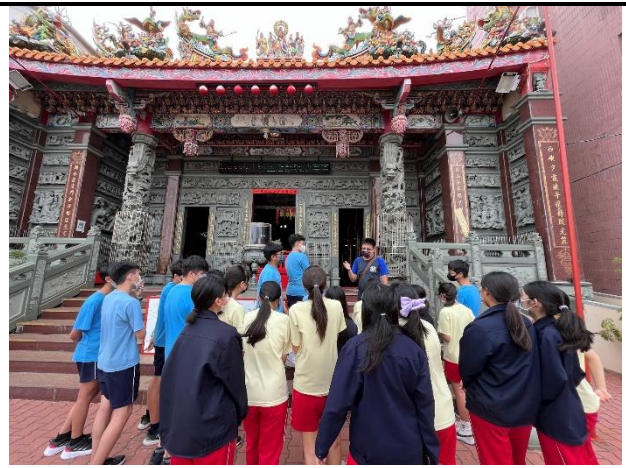
112/5/30 學生進行廟宇踏察並記錄