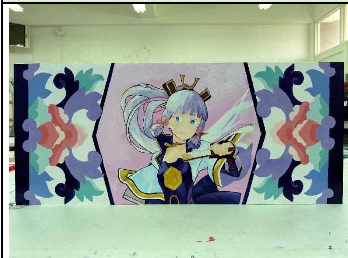
112/5/23 學生堵頭彩繪接近完成