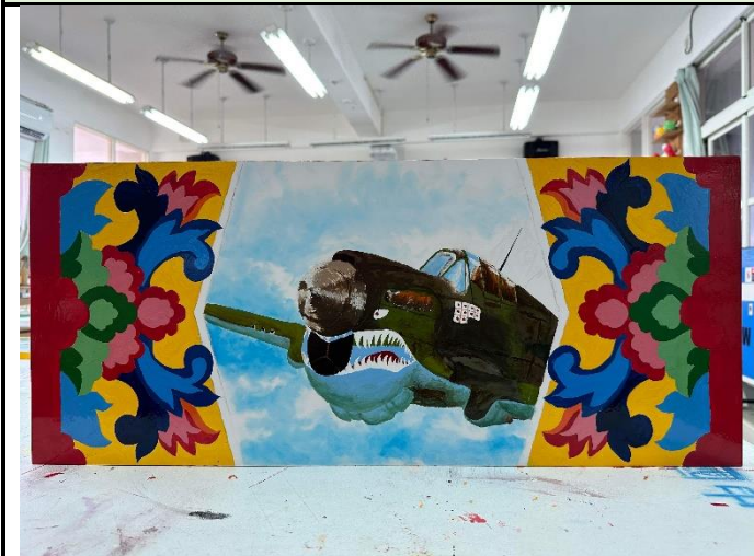
112/5/23 學生堵頭彩繪接近完成