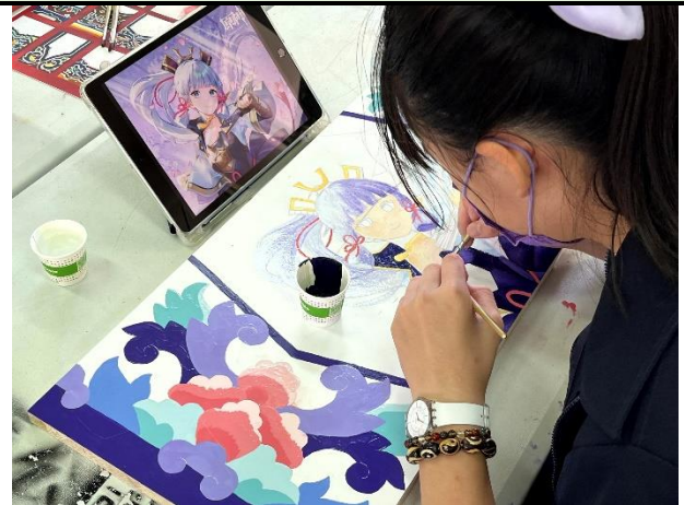
112/5/9 學生繼續進行堵頭彩繪