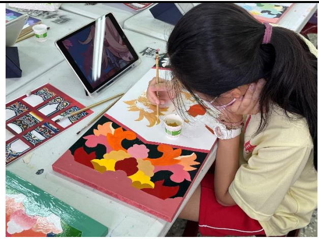
112/5/2 學生繼續進行堵頭彩繪