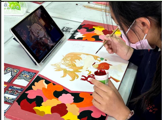
112/5/9 學生繼續進行堵頭彩繪