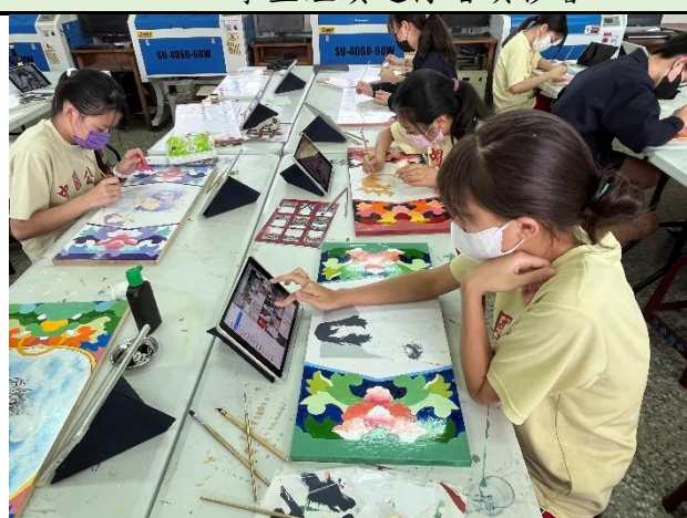
112/5/2 學生繼續進行堵頭彩繪