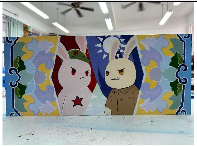
112/5/23 學生堵頭彩繪接近完成