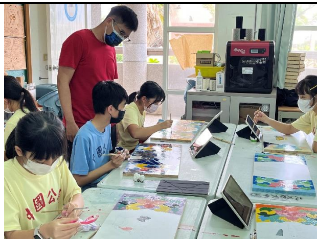
112/5/2 學生繼續進行堵頭彩繪