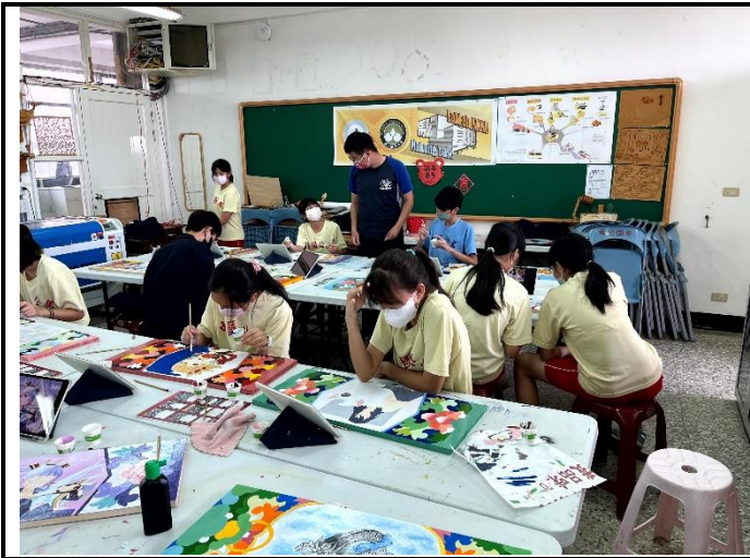
112/5/16 學生堵頭彩繪接近完成