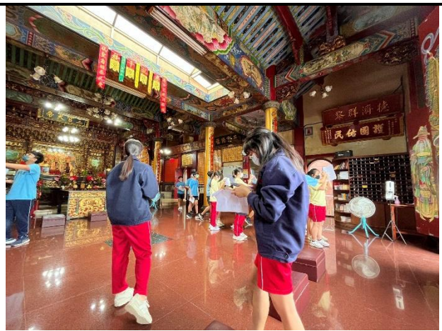
112/5/30 學生進行廟宇踏察並記錄