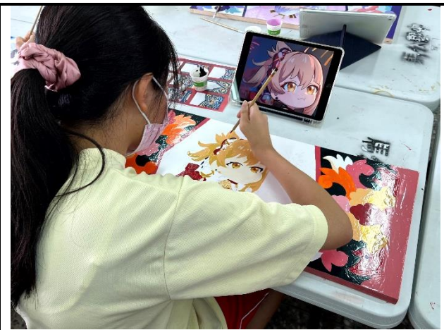
112/5/16 學生堵頭彩繪接近完成