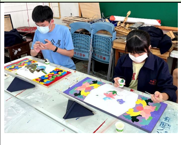
112/5/16 學生堵頭彩繪接近完成