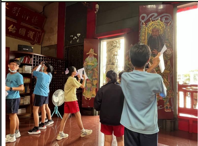
112/5/30 學生進行廟宇踏察並記錄