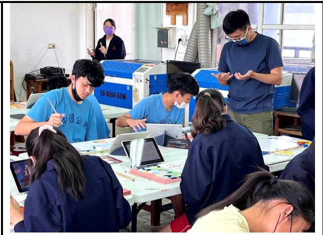
112/5/9 學生繼續進行堵頭彩繪