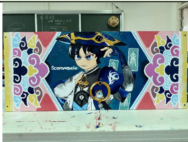
112/5/23 學生堵頭彩繪接近完成