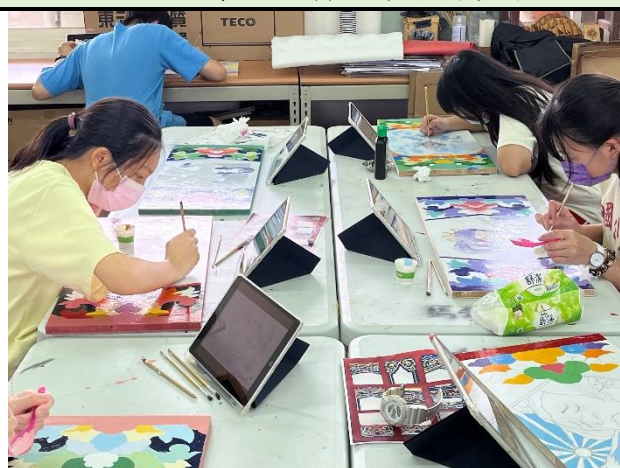
112/5/2 學生繼續進行堵頭彩繪