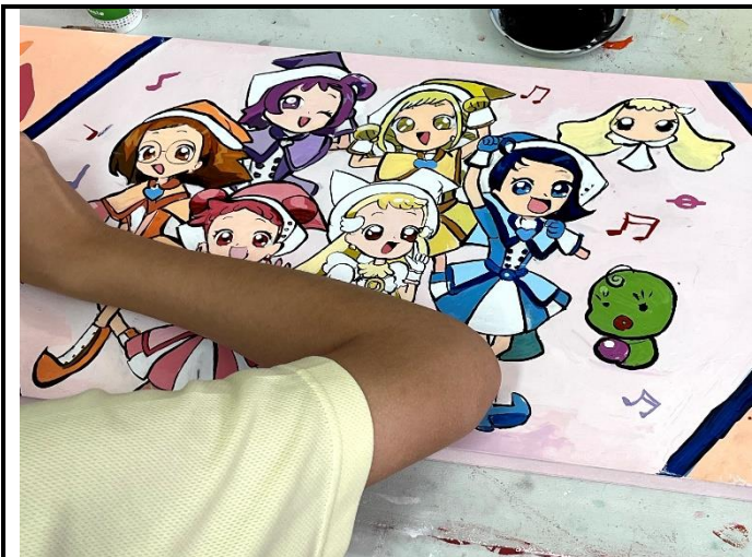
112/5/23 學生堵頭彩繪接近完成