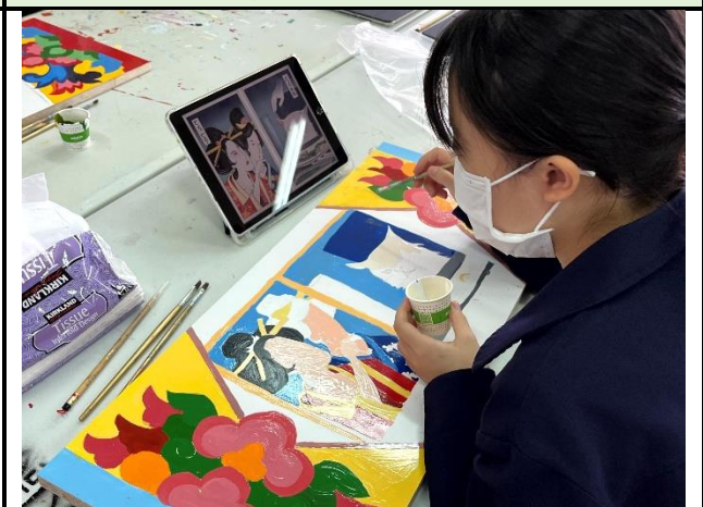
112/5/9 學生繼續進行堵頭彩繪