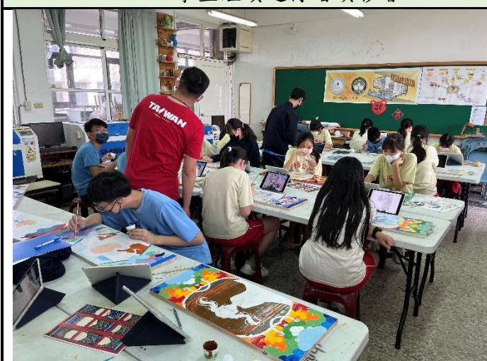
112/5/2 學生繼續進行堵頭彩繪