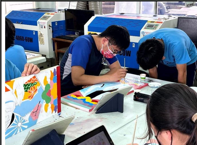
112/5/16 學生堵頭彩繪接近完成