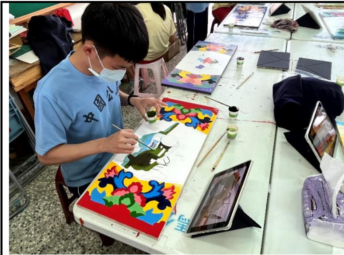
112/5/9 學生繼續進行堵頭彩繪