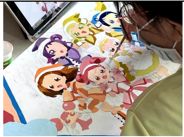
112/5/9 學生繼續進行堵頭彩繪