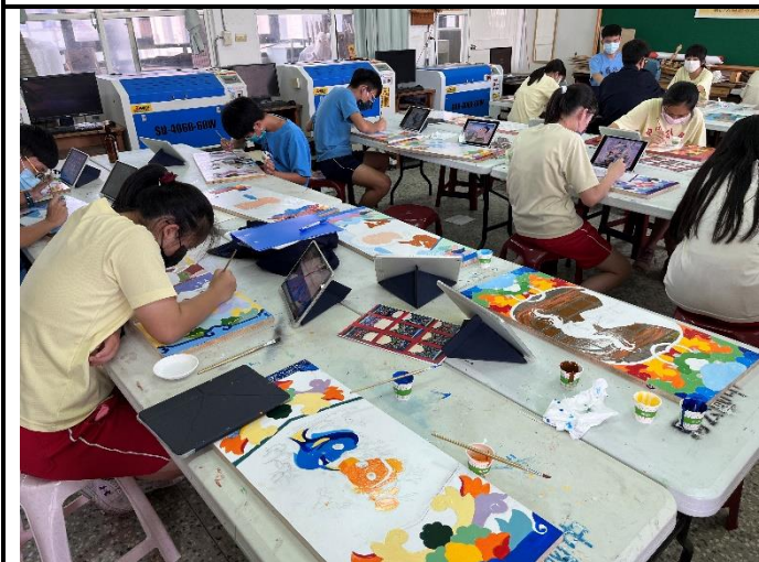
112/5/2 學生繼續進行堵頭彩繪