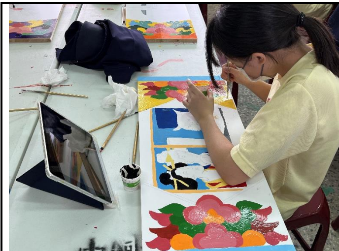
112/5/2 學生繼續進行堵頭彩繪