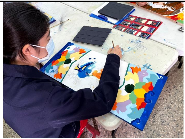
112/5/9 學生繼續進行堵頭彩繪