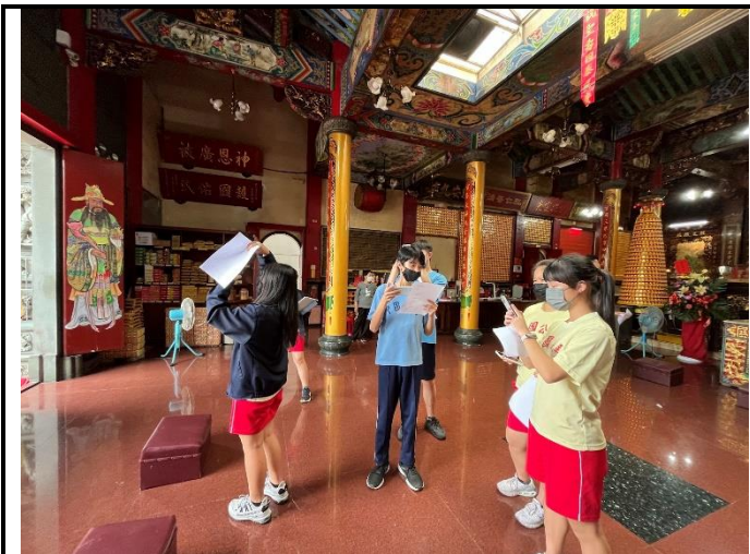
112/5/30 學生進行廟宇踏察並記錄