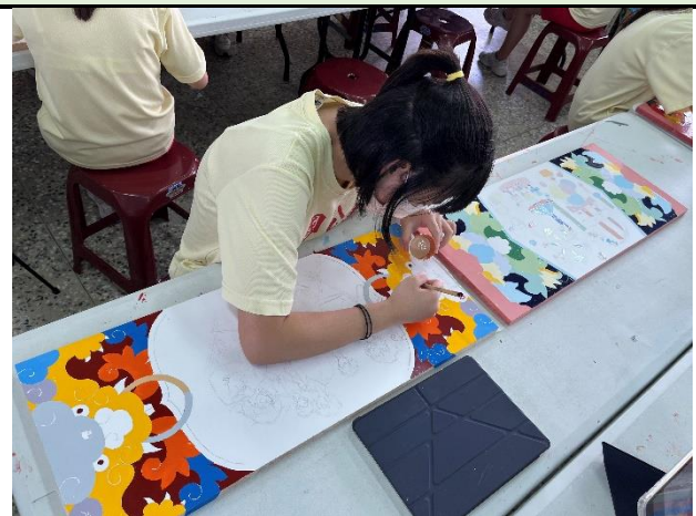
112/5/2 學生繼續進行堵頭彩繪