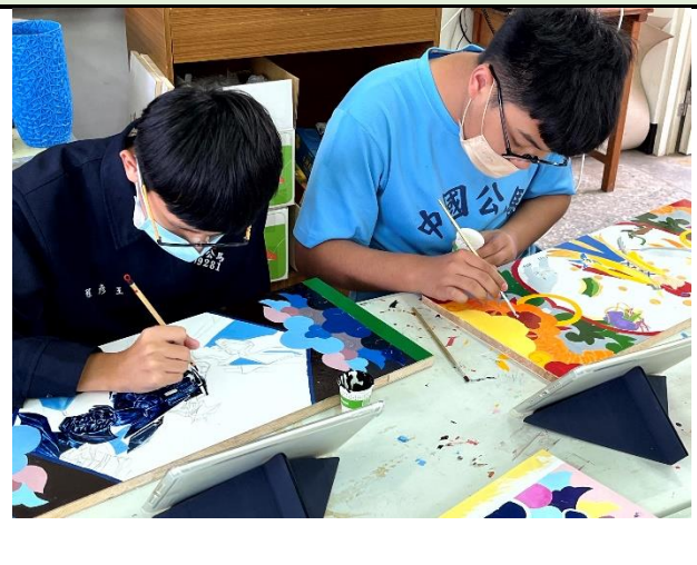
112/5/9 學生繼續進行堵頭彩繪