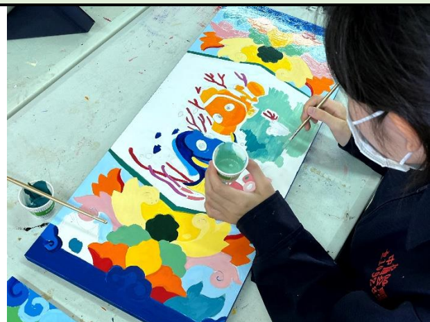
112/5/23 學生堵頭彩繪接近完成