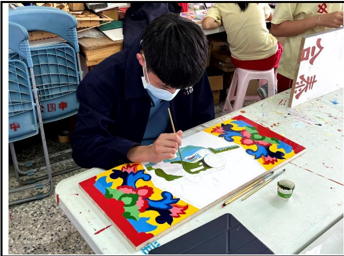
112/5/9 學生繼續進行堵頭彩繪