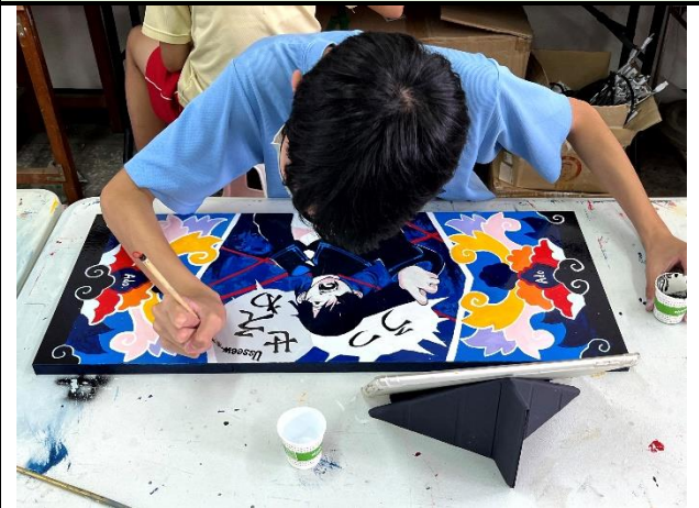
112/5/16 學生堵頭彩繪接近完成