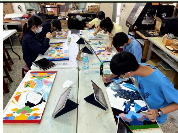
112/5/23 學生堵頭彩繪接近完成