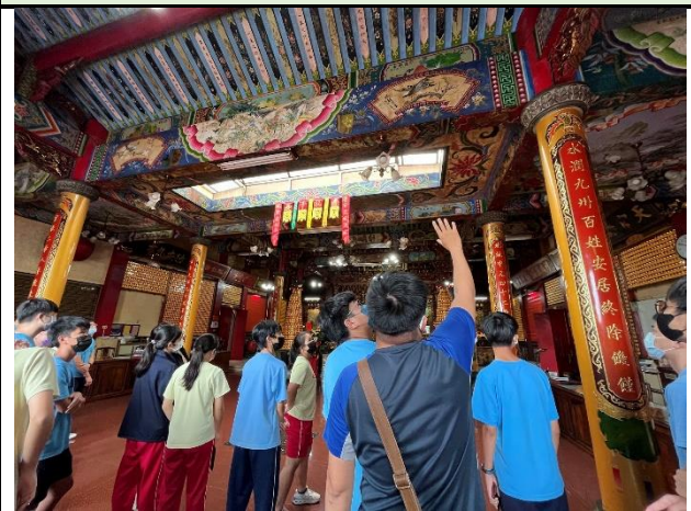
112/5/30 學生進行廟宇踏察並記錄