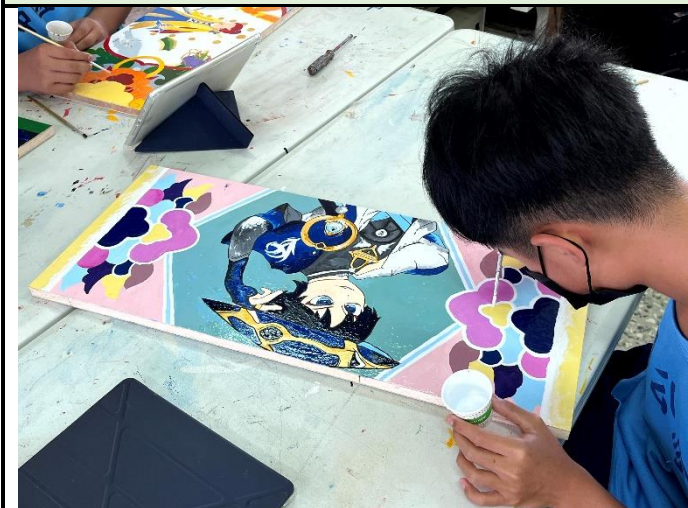
112/5/9 學生繼續進行堵頭彩繪