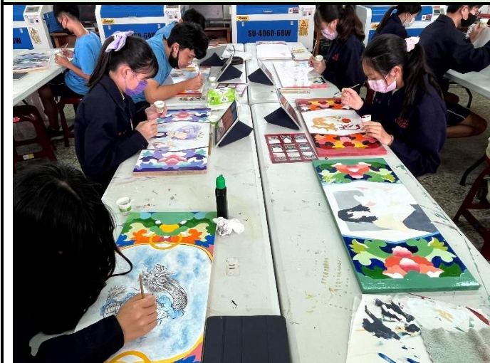
112/5/9 學生繼續進行堵頭彩繪