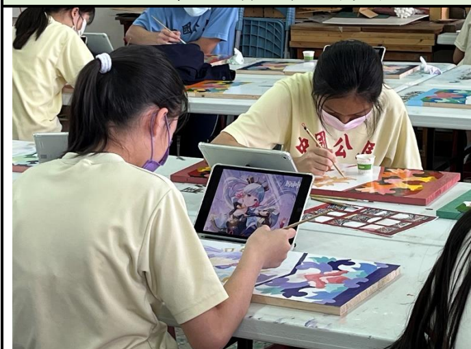
112/5/2 學生繼續進行堵頭彩繪