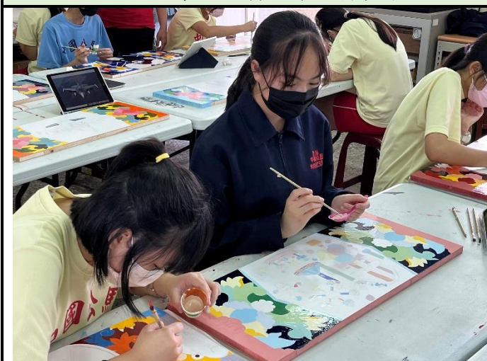
112/5/2 學生繼續進行堵頭彩繪