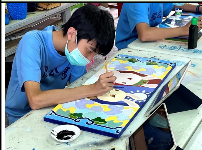
112/5/23 學生堵頭彩繪接近完成