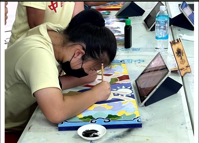
112/5/23 學生堵頭彩繪接近完成