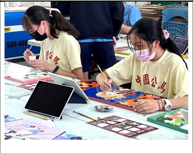
112/5/23 學生堵頭彩繪接近完成