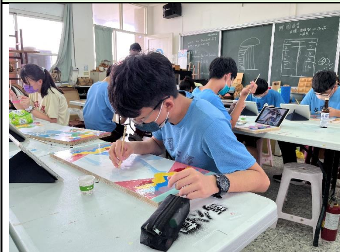
112/5/2 學生繼續進行堵頭彩繪