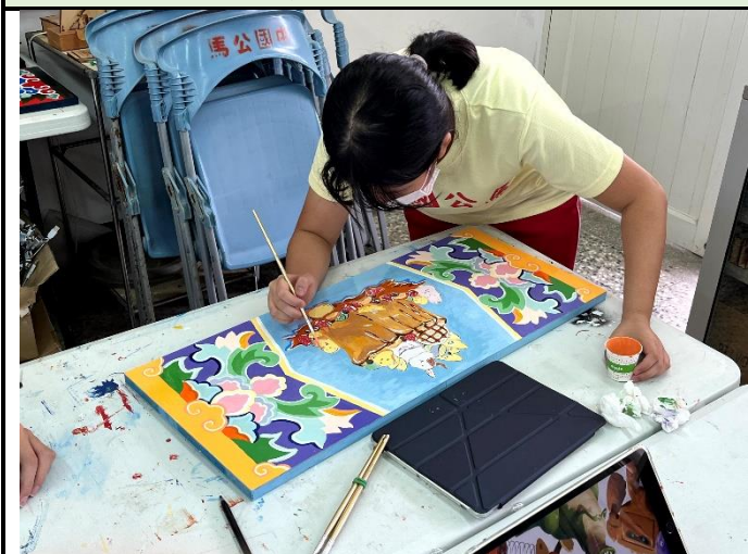
112/5/16 學生堵頭彩繪接近完成