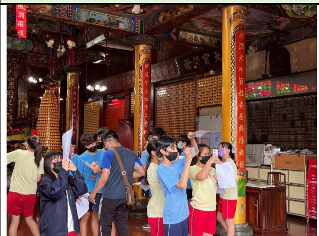
112/5/30 學生進行廟宇踏察並記錄