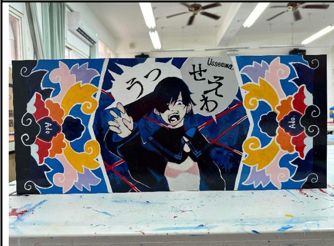
112/5/23 學生堵頭彩繪接近完成