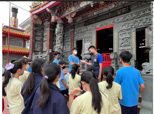
112/5/30 學生進行廟宇踏察並記錄