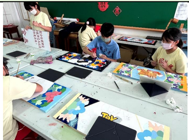
112/5/9 學生繼續進行堵頭彩繪