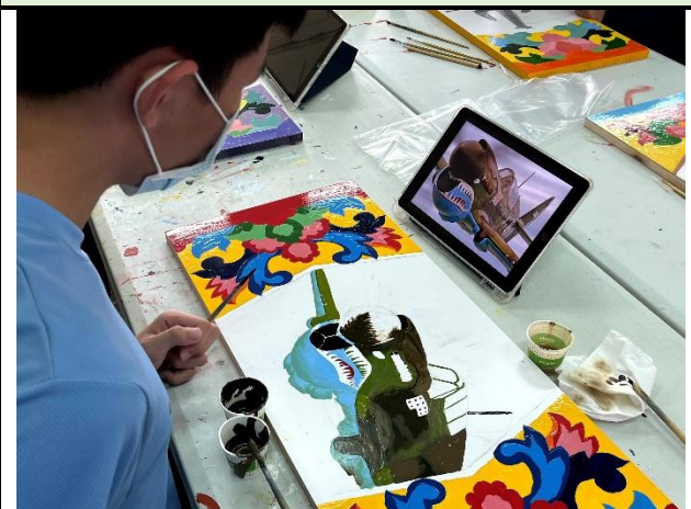
112/5/16 學生堵頭彩繪接近完成