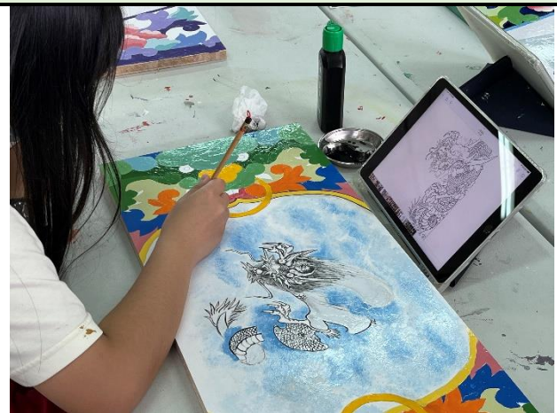
112/5/2 學生繼續進行堵頭彩繪