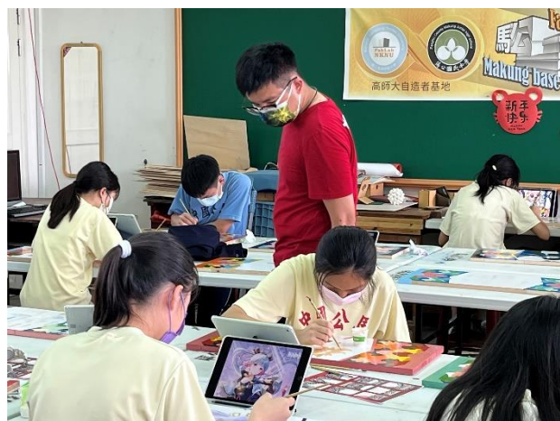
112/5/2 學生繼續進行堵頭彩繪