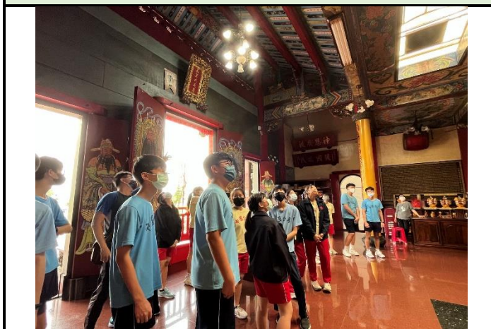
112/5/30 學生進行廟宇踏察並記錄