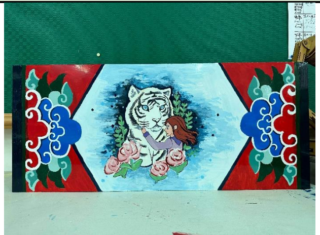
112/5/23 學生堵頭彩繪接近完成