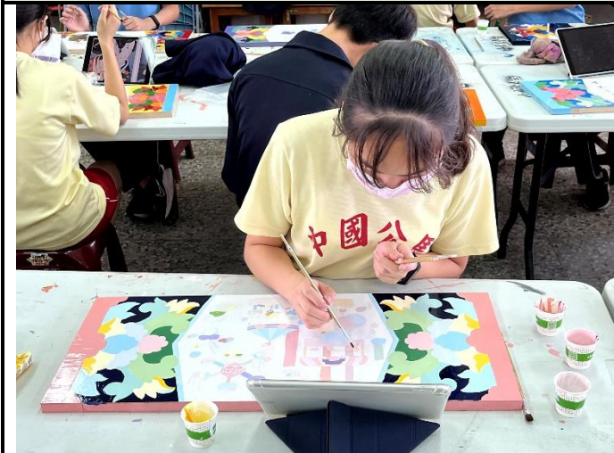
112/5/9 學生繼續進行堵頭彩繪