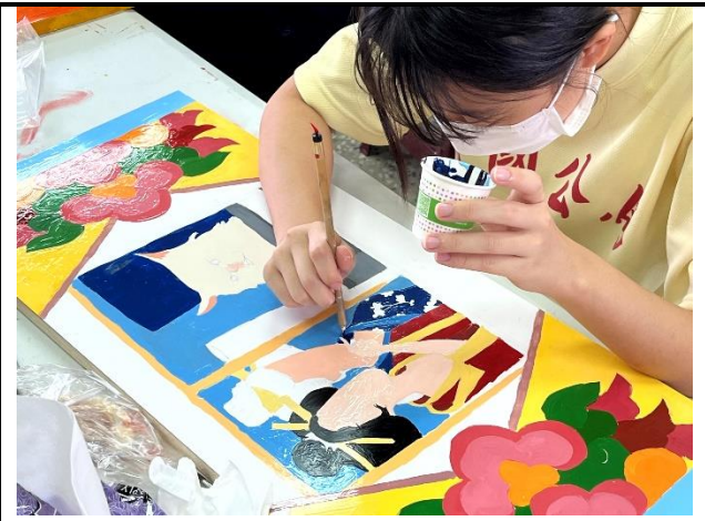
112/5/9 學生繼續進行堵頭彩繪