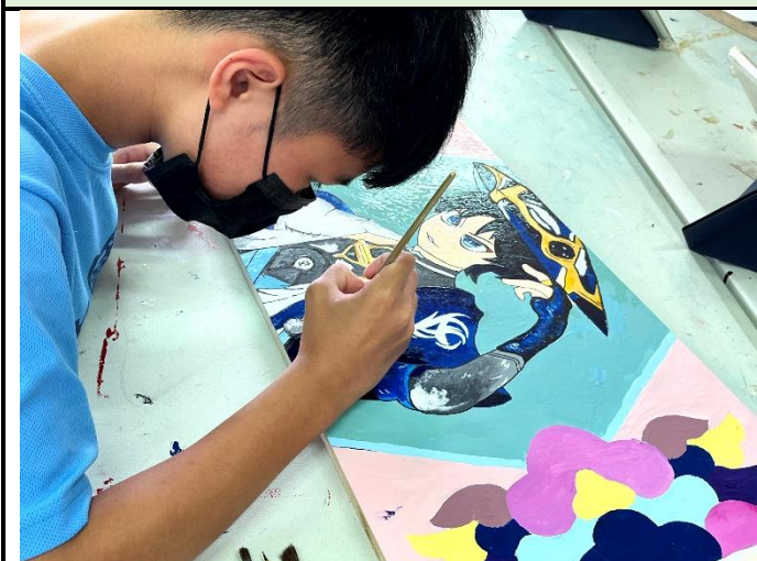
112/5/9 學生繼續進行堵頭彩繪