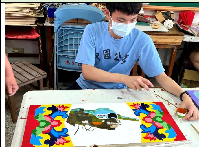
112/5/23 學生堵頭彩繪接近完成