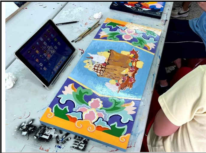
112/5/9 學生繼續進行堵頭彩繪