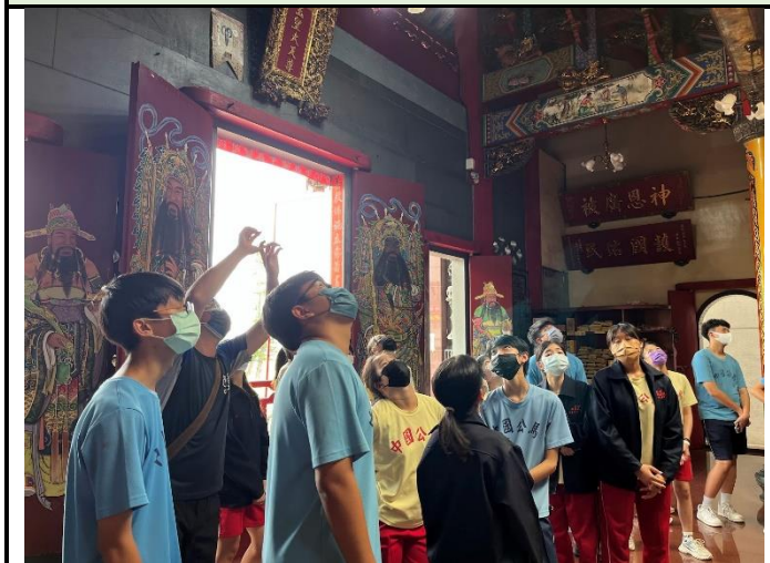
112/5/30 學生進行廟宇踏察並記錄