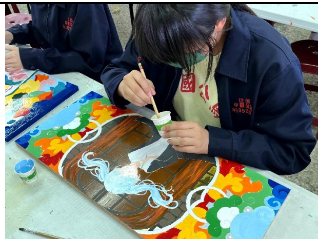
112/5/23 學生堵頭彩繪接近完成