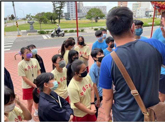
112/5/30 學生進行廟宇踏察並記錄