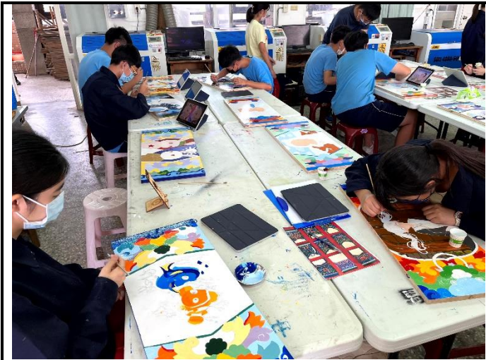
112/5/9 學生繼續進行堵頭彩繪