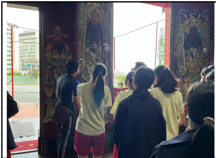
112/5/30 學生進行廟宇踏察並記錄