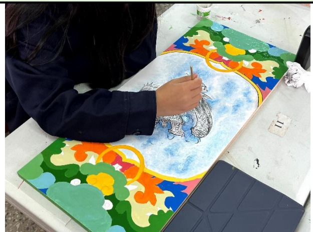
112/5/9 學生繼續進行堵頭彩繪