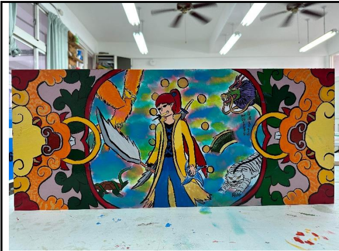
112/5/23 學生堵頭彩繪接近完成