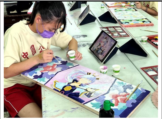
112/5/16 學生堵頭彩繪接近完成