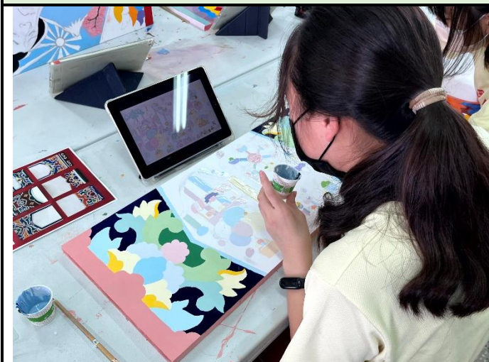
112/5/16 學生堵頭彩繪接近完成