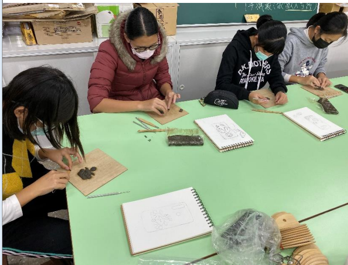
設計圖繪製與油土雕塑