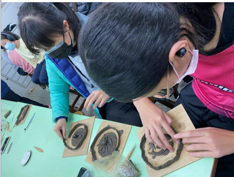
圍泥條準備石膏翻模