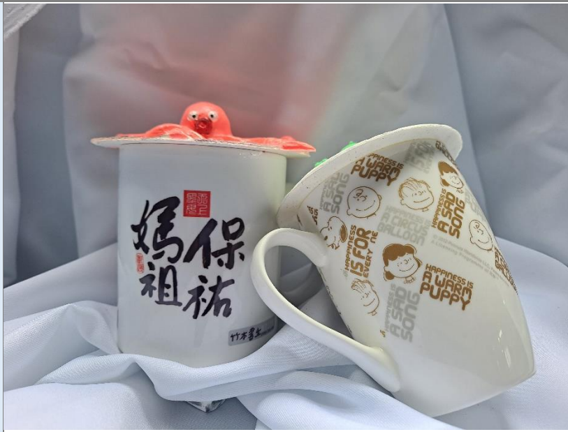
我的創作我的品味生活