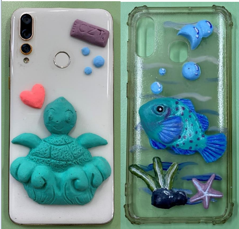
我的創作我的品味生活