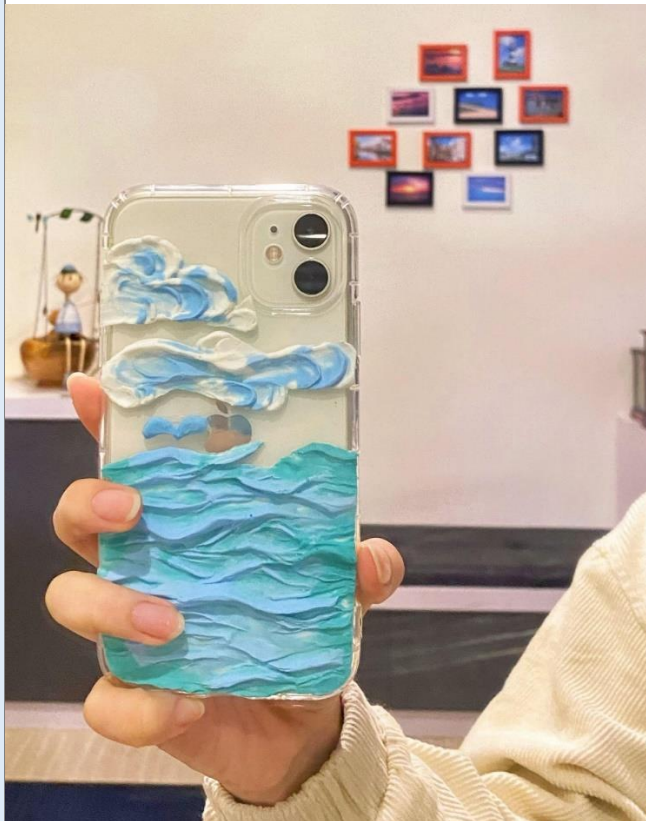
我的創作我的品味生活