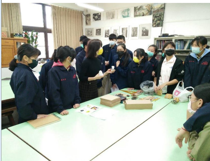
油土雕塑工具介紹與浮雕示範