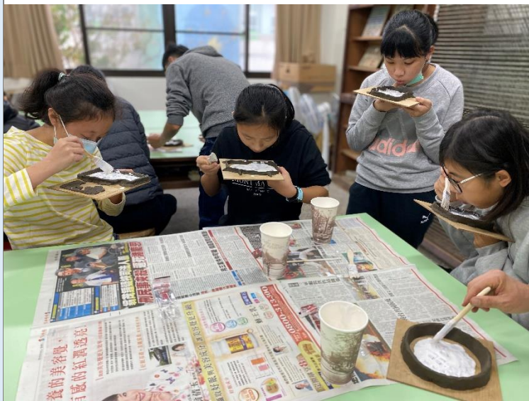
石膏翻模及處理氣泡