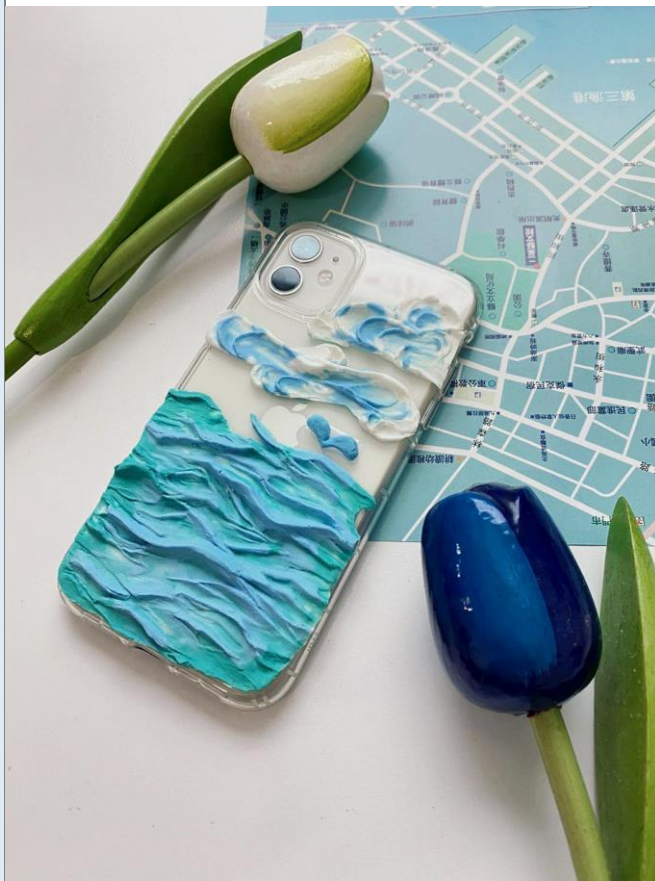
我的創作我的品味生活