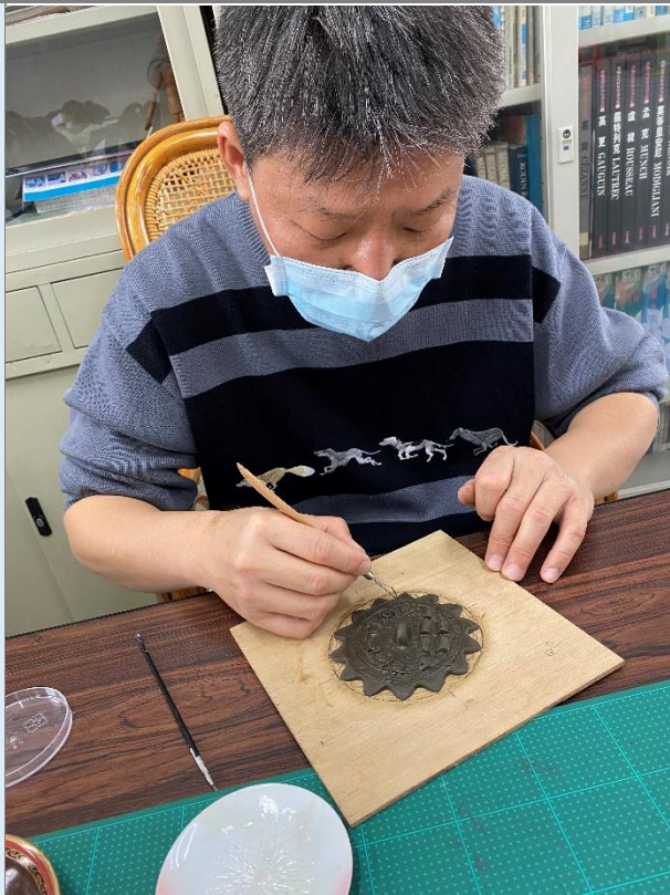
油土浮雕杯蓋塑型示範