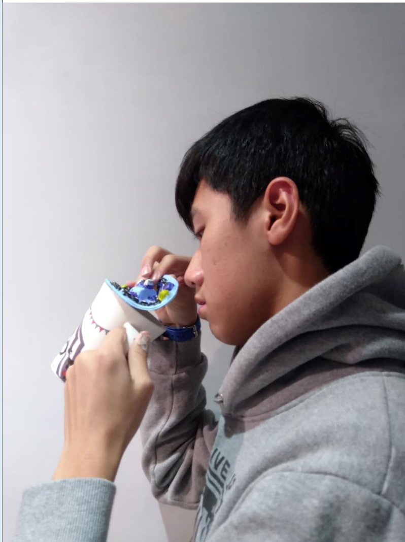
我的創作我的品味生活