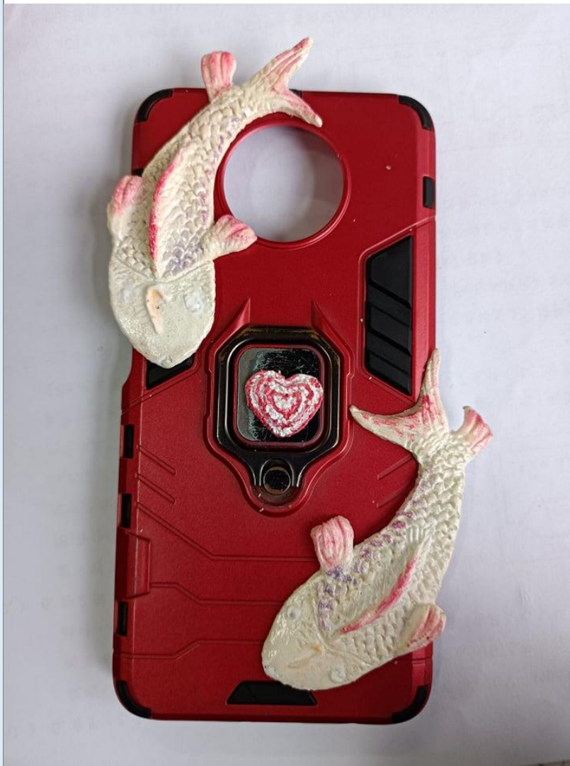
我的創作我的品味生活