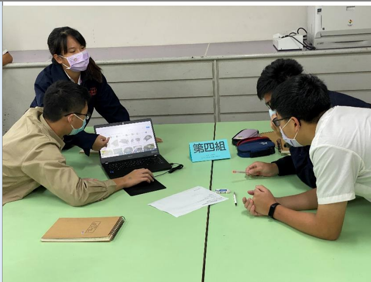
小組創意發想資料蒐集與討論