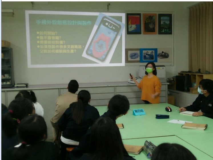
澎湖「蓋」有趣課程介紹