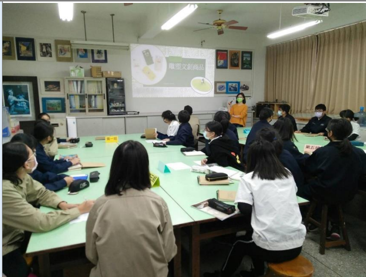
澎湖「蓋」有趣課程介紹