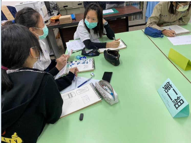
小組創意發想資料蒐集與討論