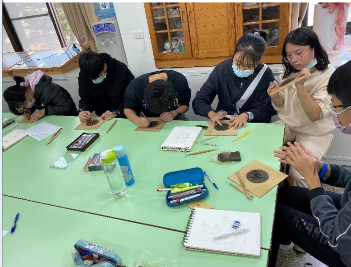
設計圖繪製與油土雕塑