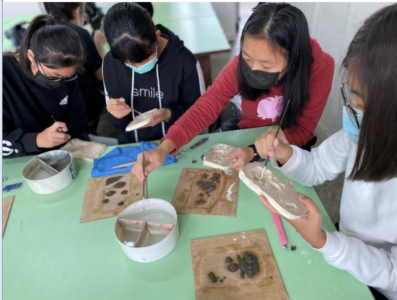
石膏模脫模後修磨處理