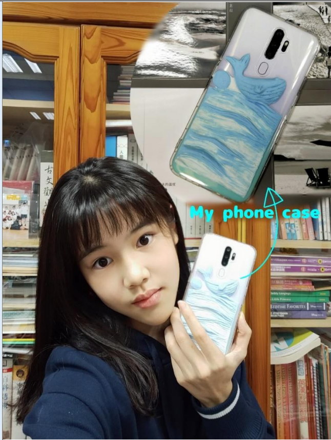
我的創作我的品味生活