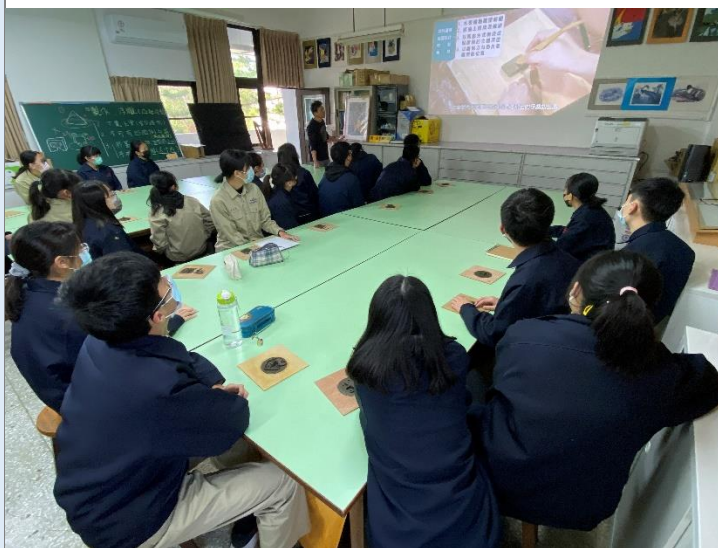
油土雕塑與翻模流程影片介紹