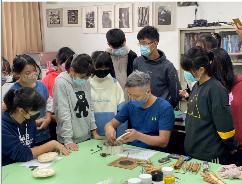
石膏模脫模後修磨示範