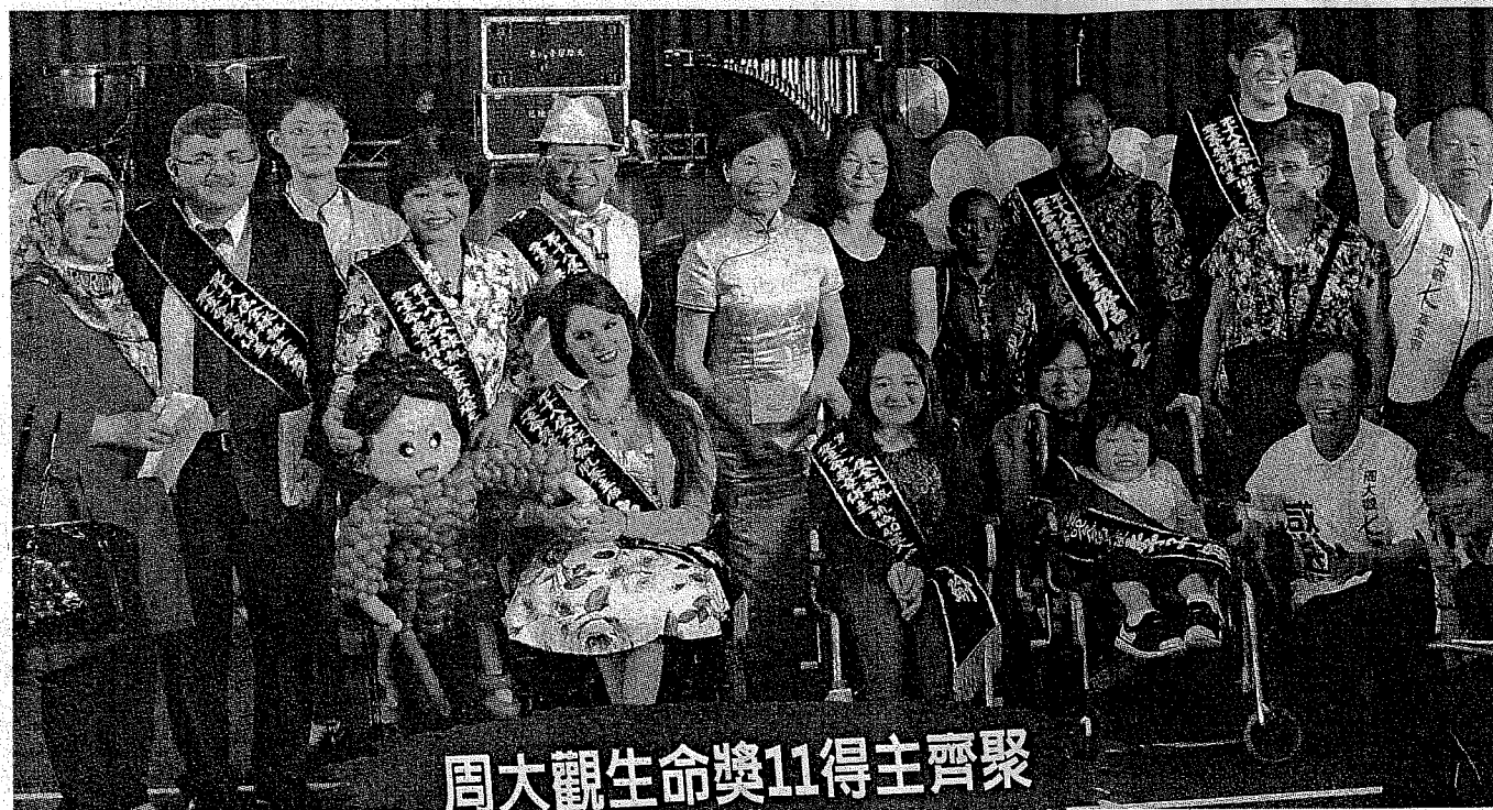
周大觀生命獎11得主齊聚

廣告專線: 02-6632-9619 E-mail: news.ct@chinatimes.com.tw